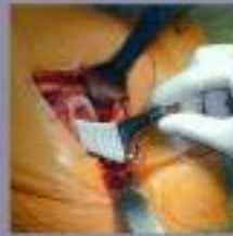
De heupkop wordt in de poot van het beugelbeen vastgezet en de heup wordt dicht over de kop.